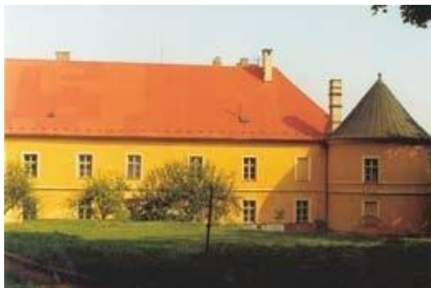
Starobylý kašticeľ školou